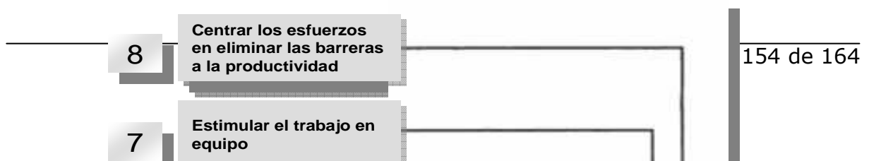
Gráfica 7. Bases de la Participación.